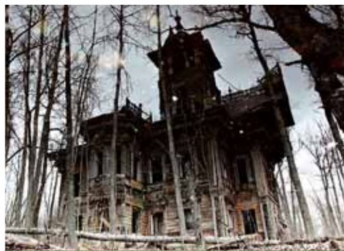
Заброшенный дом из д. Погорелово 20 лет назад