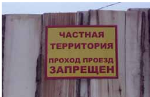
Такие таблички красуются по всему периметру забора, отгородившего деревню Башки от остального мира