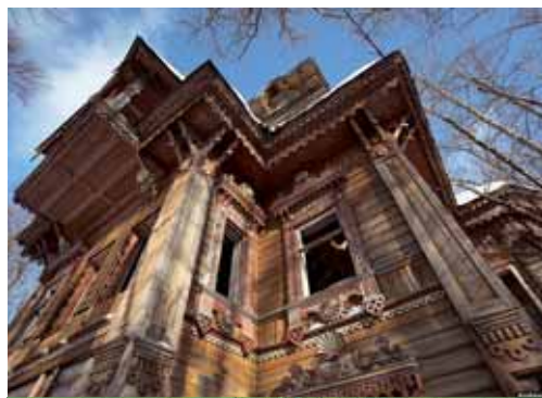
Так терем выглядит теперь

Неподалеку от Чухломы стоят два замечательных терема, запряганных между лесами и заброшенными деревьями. Сохранились они, благодаря увлеченным людям и их беспокойным сердцам.