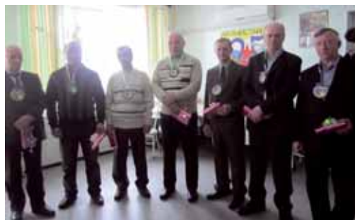
Антроповские афганцы и сейчас держатся вместе