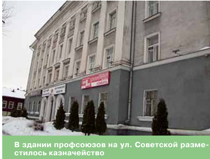
В здании профсоюзов на ул. Советской разместилось казначейство