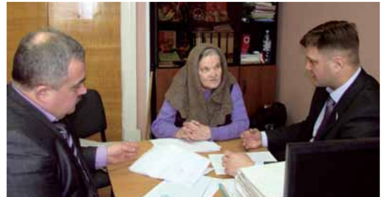
Депутаты ведут прием по личным вопросам

ков в райцентре пришли на прием к депутатам с просьбой проконтролировать, исполнит ли свое обещание руководство местного МУП «ЖКХ». Когда стояли сильные морозы, в квартирах этого дома температура была не более 15 градусов. Управляющая компания в ответ на возмущение жильцов пообещала провести перерасчет по оплате за потребленное тепло. Антроповцы надеются, что при вмешательстве областных депутатов МУП «ЖКХ» не забудет об этом.