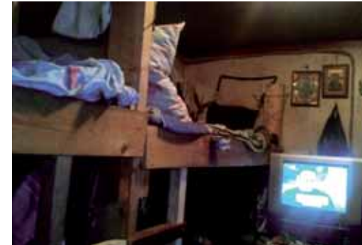
Комфорт в двух уровнях. Из плюсов — наличие телевизора