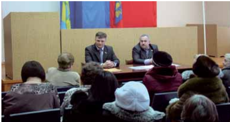
На встрече с жителями поселка