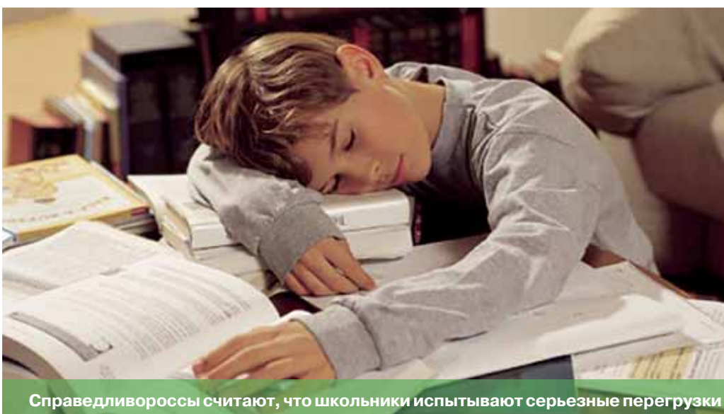
Справедливороссы считают, что школьники испытывают серьезные перегрузки

Девять депутатов фракции «Справедливая Россия» в Государственной Думе РФ, среди которых Сергей Мионов, Николай Левичев, Андрей Озеров и другие, внесли изменения в статью 66 Федерального закона «Об образовании в РФ». Законопроектом предлагается установить пятидневную учебную неделю с учетом максимальной недельной учебной нагрузки и соответствия санитарно-гигиеническим требованиям.