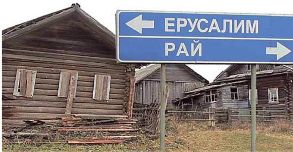
Жизнь в Раю совсем не сахарная

парня-отца семейства, найти себе место с нормальным заработком в деревнях сегодня невозможно. Даже директор колхоза получает меньше, чем охранник магазина в столице.