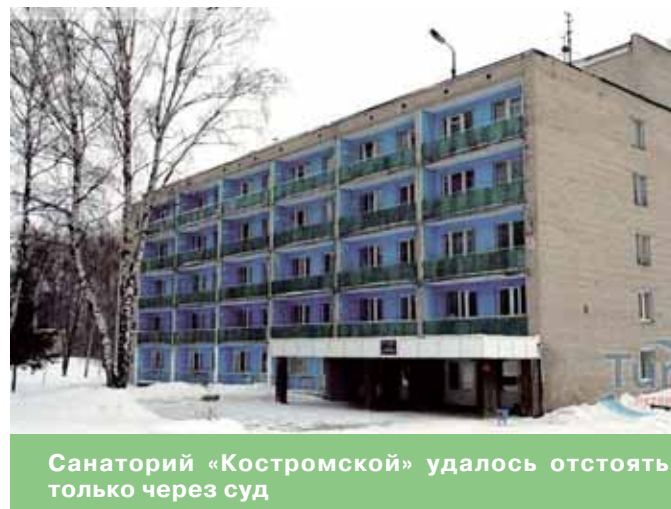
Санаторий «Костромской» удалось отстоять только через суд