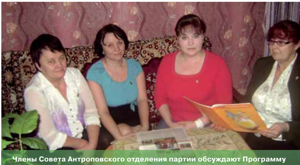
Члены Совета Антроповского отделения партии обсуждают Программу

получающих заработную плату меньше 10 тысяч рублей».