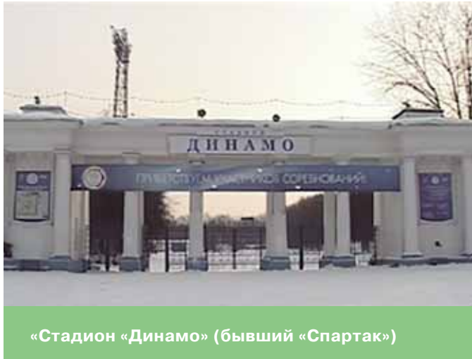
«Стадион «Динамо» (бывший «Спартак»)