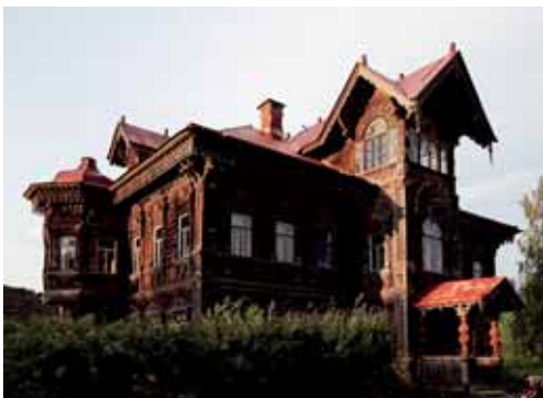
Сказочный дом восстановили в деревне Асташево