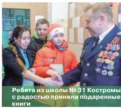
Ребята из школы № 31 Костромы с радостью приняли подаренные книги