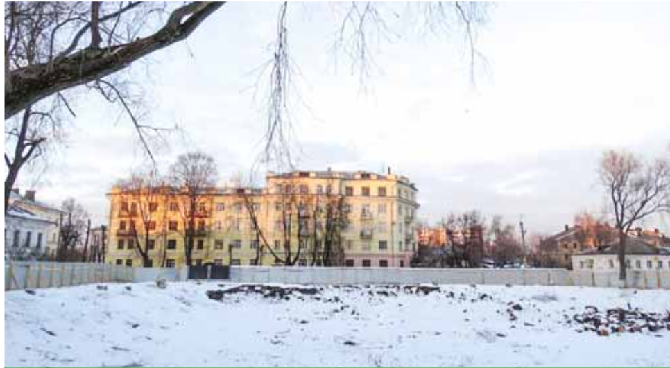
Застройщики ушли, а забор вокруг большой территории остался