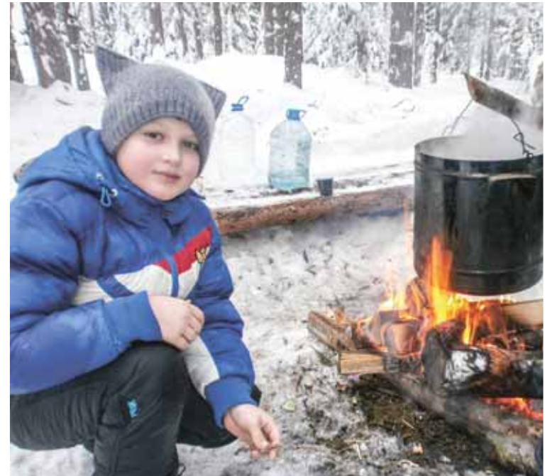
После забега чай у лесного костра – лучшее угощение!

8 февраля справедливороссы Кологрива поддержали хорошее начинание, которое уже стало доброй традицией, – открытую всероссийскую массовую лыжную гонку «Лыжня России-2015».