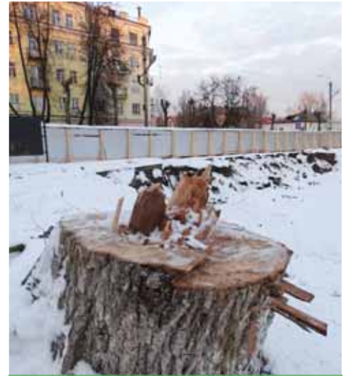
А липа могла бы еще жить и жить...

Строительство на пруду сначала приостановили, а 16 февраля открыто объявили о сворачивании этого нашумевшего проекта. Но теперь возникла другая проблема: инвестор, планировавший возвести на пруду кафе, уже выплатил городу за аренду земельного участка около 4,5 миллиона рублей. И не исключено, что он потребует вернуть напрасно потраченные деньги