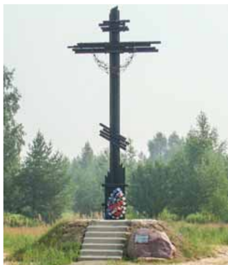
Поклонный крест установили в память о заключенных Унжлага

уйдя на пенсию, она продолжала сбор материала по истории существования Унжлага и систематизировала его. 15 лет кропотливой работы и желание публично рассказать об Унжлаге.