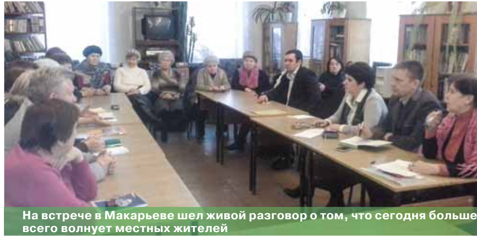
На встрече в Макарьеве шел живой разговор о том, что сегодня больше всего волнует местных жителей

не едут молодые специалисты, некому осваивать современную аппаратуру, которой оснащена больница. Участницы встречи предложили вернуть практику распределения молодых специалистов. Только такая мера будет способствовать закреплению молодых кадров в районах области, в частности, в медицине.