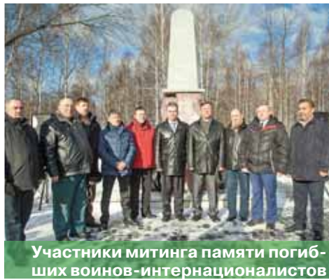
Участники митинга памяти погибших воинов-интернационалистов