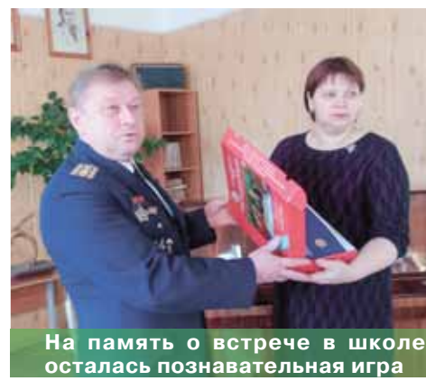
На память о встрече в школе осталась познавательная игра