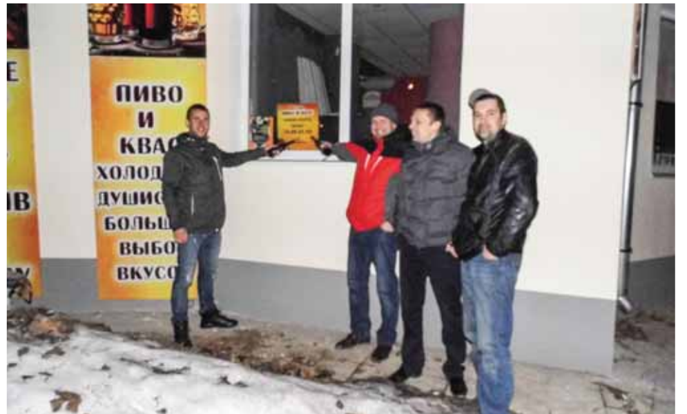
В этом магазине на ул. Ленина, 96 в Костроме продают алкоголь с нарушениями

лицию, и прибывший наряд зафиксировал факт нарушения в установленном порядке. Теперь руководство магазина и продавец будут привлечены к ответственности по закону.