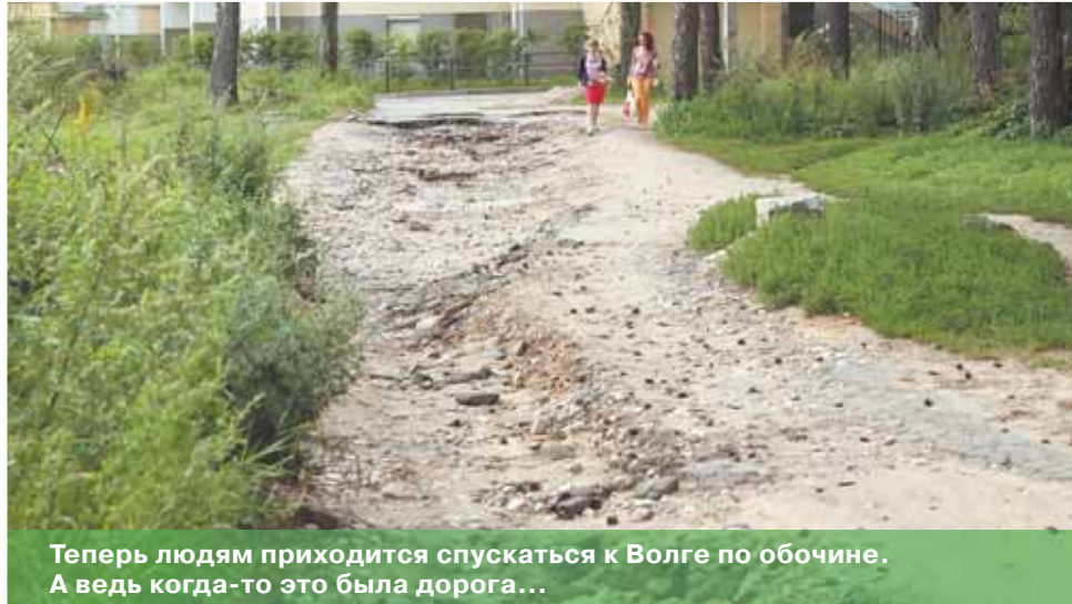
Теперь людям приходится спускаться к Волге по обочине. А ведь когда-то это была дорога...

людей, поскольку это кратчайший путь к реке. Но после обильных дождей грунтовую дорогу размывло, и привычный спуск превратился в самый настоящий овраг, преодолеть который могут лишь физически подготовленные, крепкие и спортивные люди.