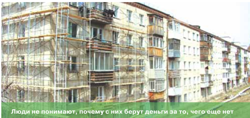
Люди не понимают, почему с них берут деньги за то, чего еще нет

в этом случае «кидалова» не будет, как это нередко бывает там, где с горожан берут деньги за будущие услуги.