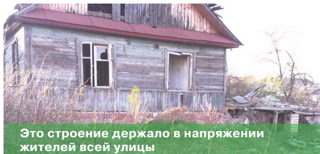
Это строение держало в напряжении жителей всей улицы