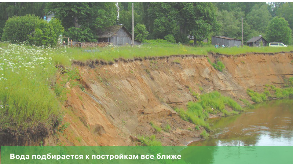
Вода подбирается к постройкам все ближе