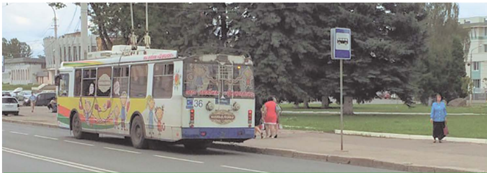
Горожанам на остановках не спрятаться от дождя

люди так же теперь лишены возможности с удобством дожидаться общественного транспорта.