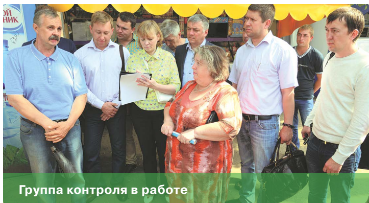
Группа контроля в работе