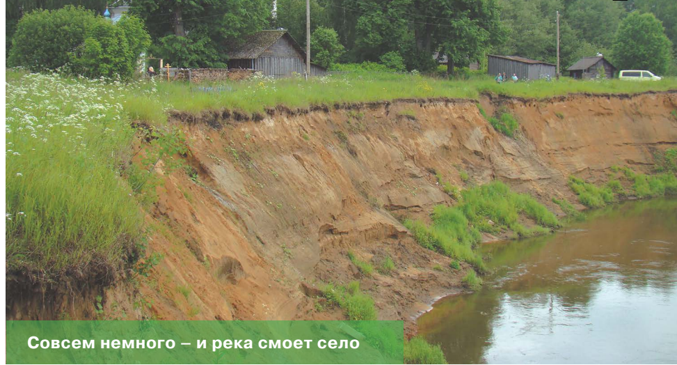
Совсем немного – и река смывает село

своими силами строительство скважины им не осилить.