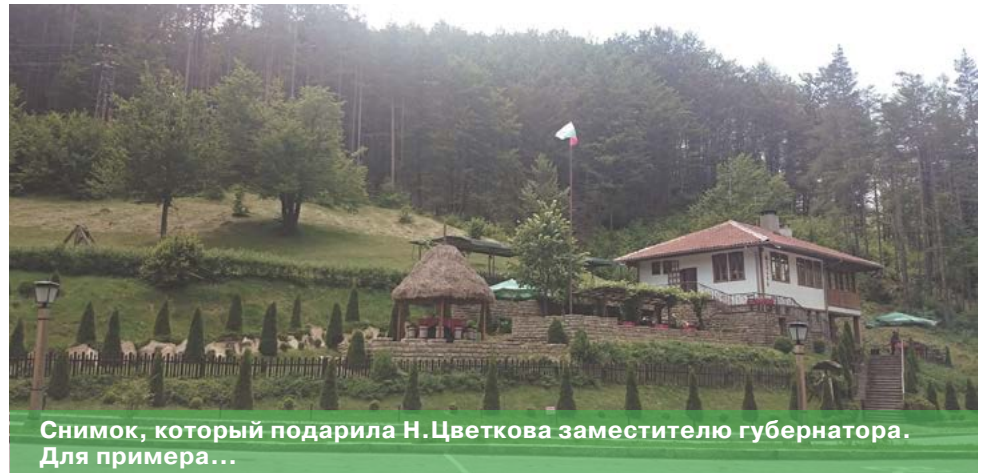
Снимок, который подарила Н. Цветкова заместителю губернатора. Для примера...

Кроме того, замгубернатора поддержал обозначенные предлагаемые границы территории ландшафтного парка «Заволжье» слева и справа от моста и высказался за создание адекватного Положения о проведении конкурса вместо технического задания.