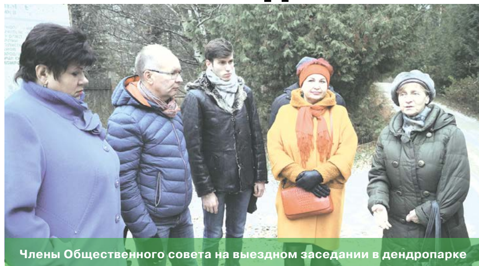
Члены Общественного совета на выездном заседании в дендропарке

Тем не менее, были на Совете и позитивные моменты. Члены Совета выехали в костромской дендрарий, чтобы на месте обсудить перспективы его развития. Сейчас в парке собрано