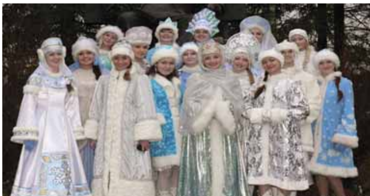
Товарных знаков с именем Снегурочки становится все больше. Как и путаницы с самими ледяными внучками...