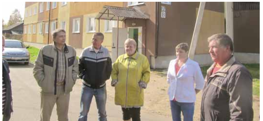
Жильцы домов устали бороться с чиновниками за свое право жить в нормальных условиях

В прошлом году по инициативе жильцов оба дома обследовали специалисты. Была проведена строительно-техническая экспертиза, которая установила несоответствие построенных жилых домов проектной и нормативно-технической документации. Кроме того, выяснилось, кровля зданий выполнена из материала, вообще не предназначенного для этих целей. Эксперты признали, что существующие дефекты в домах устранить невозможно, и такое жилье непригодно для проживания. Профнастил, использованный для покрытия крыш, не соответствует ГОСТу, оконные блоки не соответствуют нормативно-технической документации по сопротивлению теплопередачи,