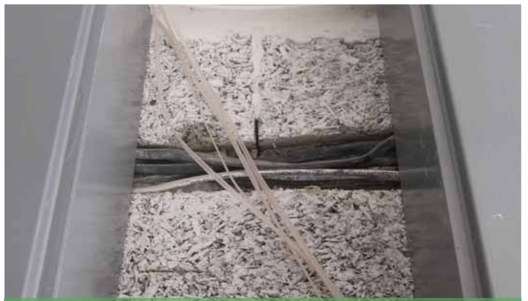
Из такого материала «состряпаны» оба дома