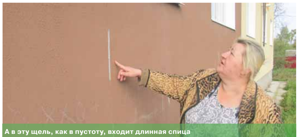
А в эту щель, как в пустоту, входит длинная спица