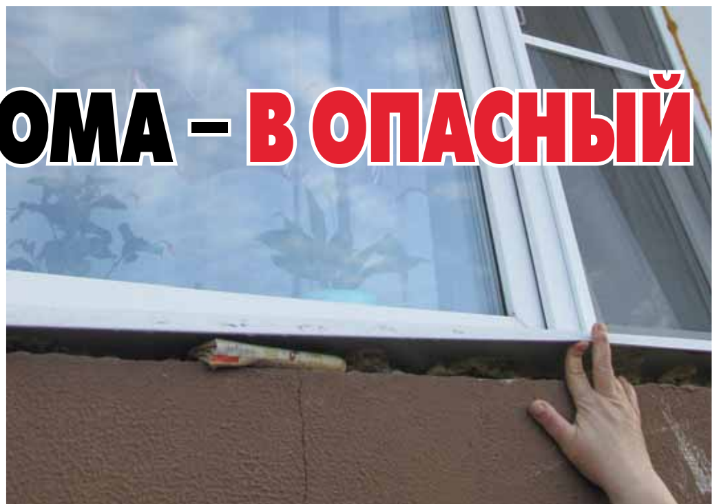
Между стеной и рамой можно просунуть кулак

P. S. Когда верстался номер, мы узнали, что в Бую направляется специальная комиссия представителей фонда содействия реформированию ЖКХ, а также сотрудники центра независимого мониторинга исполнения указов президента РФ «Народная экспертиза» и регионального центра общественного контроля в сфере ЖКХ. Комиссия проведет внеплановую проверку ситуации с домами по улице Чапаева. Результаты проверки могут стать неутешительными для местных чиновников, ведающих переселением. В случае, если приведенные костромскими журналистами факты подтвердятся, ФСР ЖКХ может ввести жесткие санкции, вплоть до отзыва средств, а также инициировать проверку по линии правоохранительных органов. Окончательное заключение по ситуации даст выезжающая на место комиссия. Об итогах ее работы мы расскажем читателям в одном из ближайших номеров газеты.