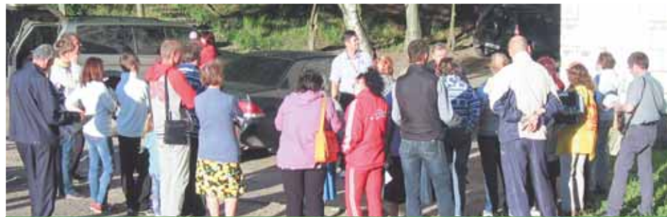
На собрании во дворе домов 30-34 в Паново