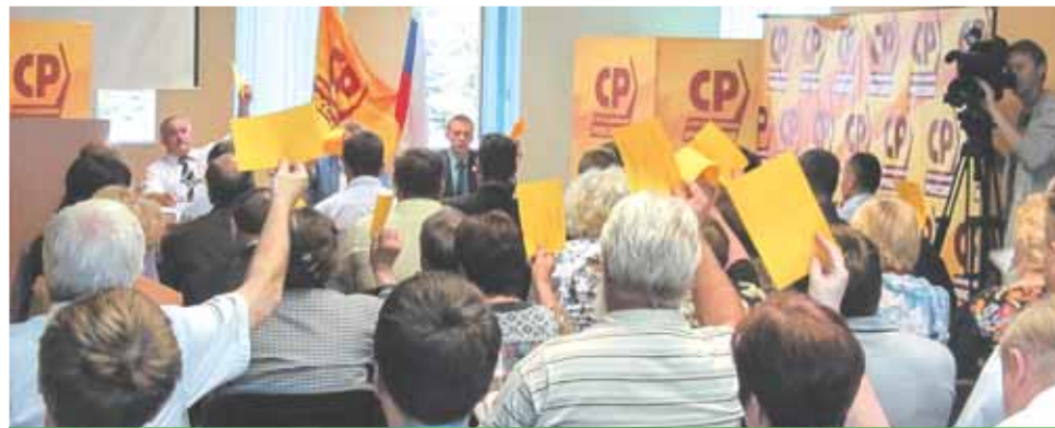
Голосуют делегаты конференции