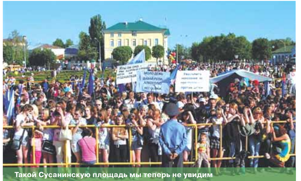
Такой Сусанинскую площадь мы теперь не увидим

стороны, если уж следовать стремлению сохранить эти места в приятном виде, то делать это всегда и без вариантов. А то митинги у пожарной каланчи мы запрещаем, а торговлю рыбой в палатках или продажу саженцев здесь же с радостью разрешаем.