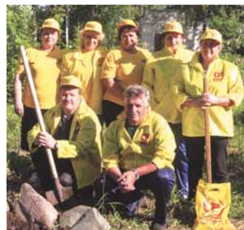
Сусанинские справедливороссы после субботника

Так, накануне Дня России партийцы с энтузиазмом поработали в скверах и парках. Разбивали клумбу, высаживали рассаду цветов, которую заранее сами и вырастили, убрали скошенную траву и упавшие ветки деревьев. Сусанинцы привыкли к добрым делам, которые делают справедливороссы. Ведь они своим примером призывают и другие общественные и политические объединения доказывать не только словом, но и конкретными делами, что чем больше мы все будем принимать участие в общественной жизни на местах, тем