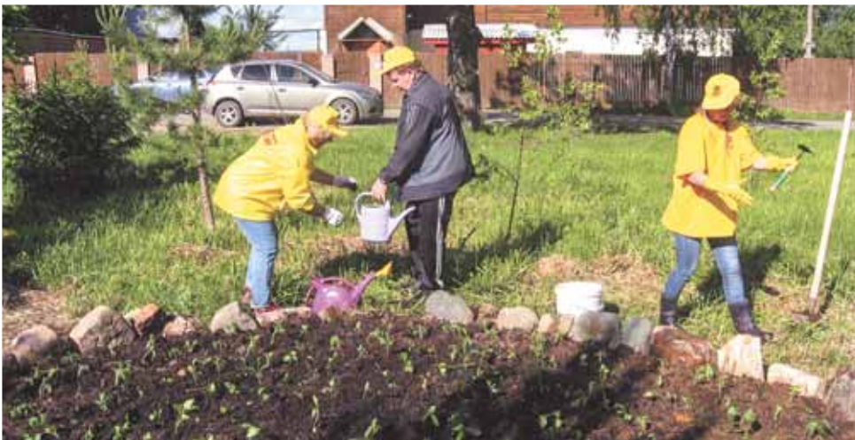
Партийцы на благоустройстве клумбы