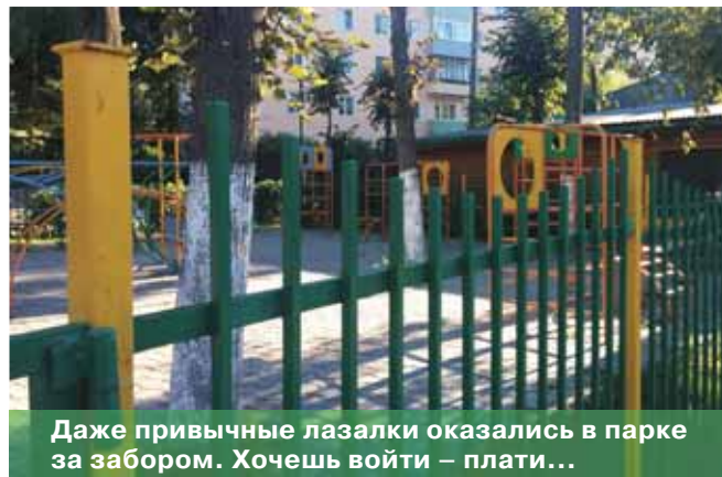
Даже привычные лазалки оказались в парке за забором. Хочешь войти – плати...