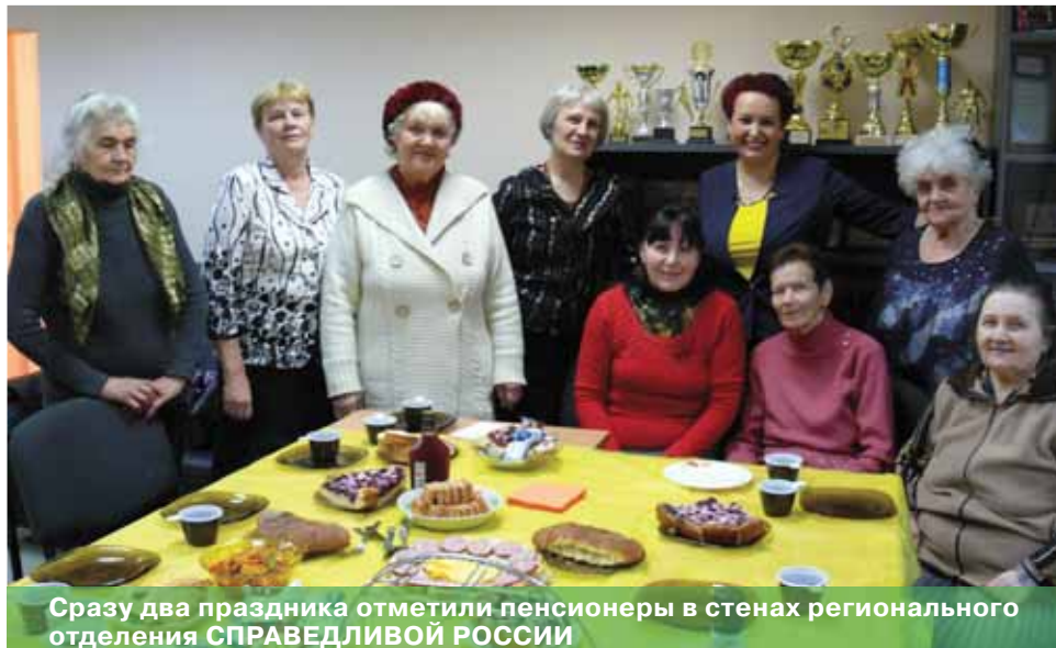
Сразу два праздника отметили пенсионеры в стенах регионального отделения СПРАВЕДЛИВОЙ РОССИИ

партии СПРАВЕДЛИВАЯ РОССИЯ всегда открыты. Все желающие смогли посмотреть, как работает Центр защиты прав граждан, открытый этой партией еще в феврале. Многие люди приехали со своими вопросами по разным про-