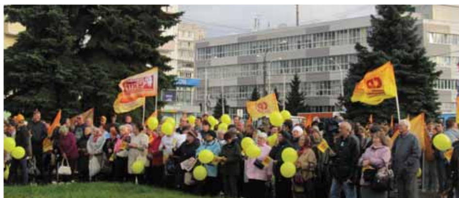
В Костроме на встречу с Сергеем Мироновым и региональными справедливороссами собрались неравнодушные горожане