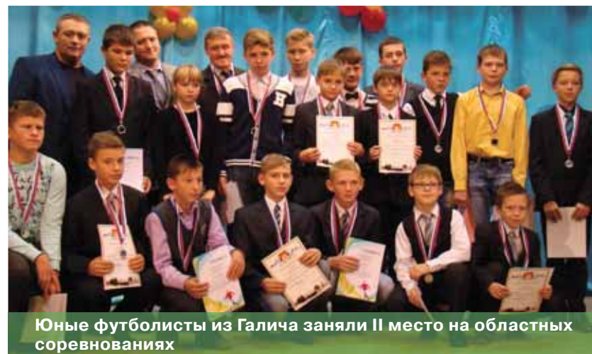
Юные футболисты из Галича заняли II место на областных соревнованиях