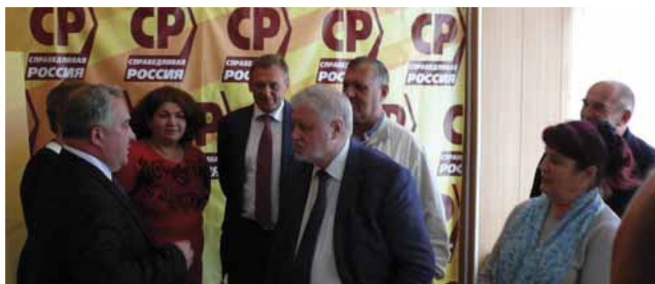
В Бую лидера справедливороссов встретили радушно