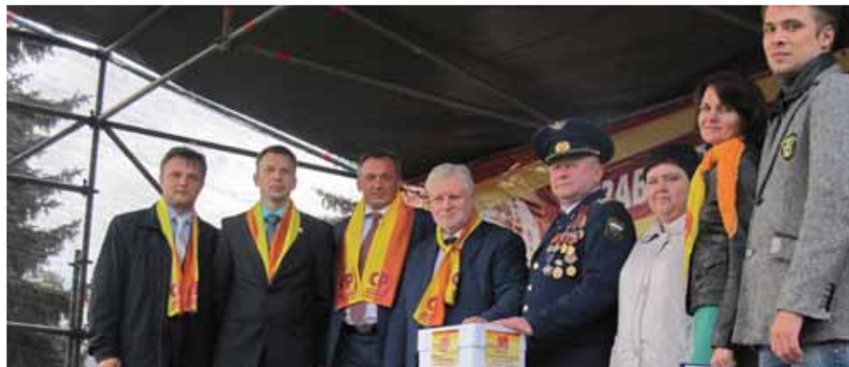
Костромичи передали лидеру СР более 50 коробок с подписями против закона о капремонте

предприятие продолжает работать и осваивает выпуск новых видов удобрений и химикатов по программе импортозамещения. Зарплата на заводе – 30 тысяч рублей при средней по райцентру 18–20 тысяч. Сергей Миронов встретился с трудовым коллективом предприятия и рассказал о программе партии. В частности, говорил о необходимости изменений в Налоговом кодексе России. Справливороссы настаивают на прогрессивной налоговой шкале: богатая элита должна платить налогов значительно больше, чем рядовые врачи или учителя. В партии даже подсчитали, что это дополнительно дало бы бюджету страны полтора триллиона рублей ежегодно. Миронов также заявил о необходимости справедливого распределения финансов между регионами и федеральным центром. Нужен закон о минимальном социальном стандарте. Необходимо рассчитать, сколько денег требуется одному жителю конкретного региона, исходя из минимальной бюджетной обеспеченности. Затем умножить эту цифру на количество проживающих в регионе людей. И, исходя из этого, определять, сколько собранных на местах доходов оставлять в регионе, а сколько отправлять в федеральную казну. Сейчас пропорции нарушены. 30% собранных налогов оставляют регионам, а 70% уходит в Центр. Сергей Миронов предлагает развернуть эту арифметику на 180 градусов или сделать хотя бы 50х50.