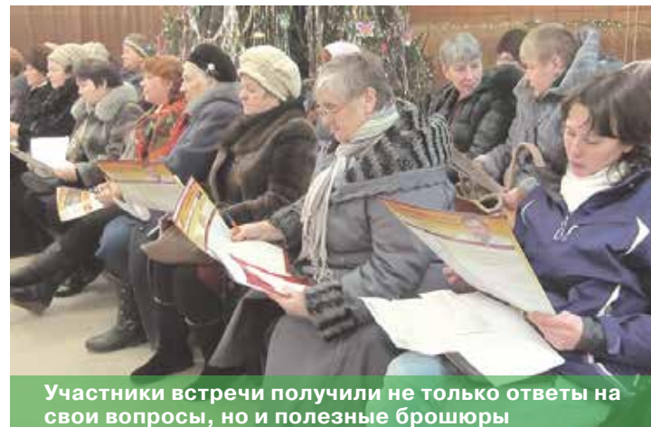
Участники встречи получили не только ответы на свои вопросы, но и полезные брошюры

но на обращения жильцов УК не реагирует, ничего не предпринимает для устранения этого нарушения.