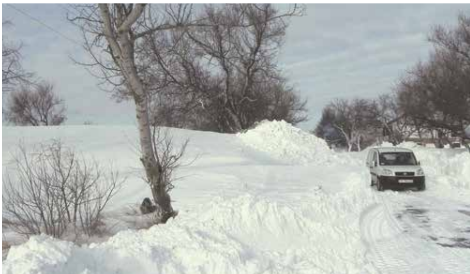
К Корцовскому сельскому поселению нормальный подъезд – только в морозы. Весной и осенью здесь непроезжая грязь...

ежегодно дает разрешение на учебу детей. Одно из зданий из-за угрозы жизни и здоровью детей вынесено в помещение детского сада, так как всех учащихся разместить в одном здании невозможно. В 1995 году было начато строительство общеобразовательной школы, построили первый этаж, который до сих пор находится в хорошем состоянии. Но потом строительство было заморожено.