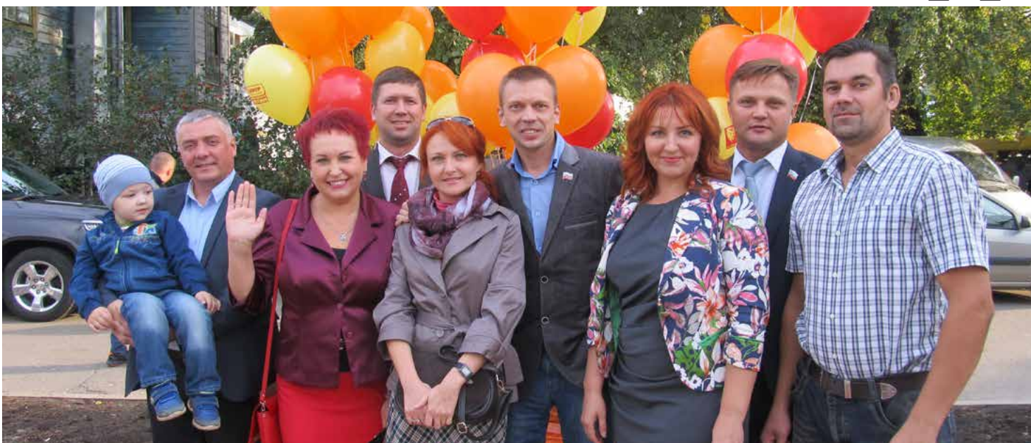
Справедливороссы Костромы пришли на открытие пруда в радостном настроении